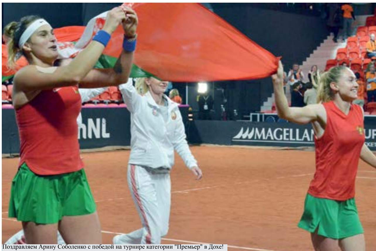
Поздравляем Арину Соболенко с победой на турнире категории "Премьер" в Дохе!